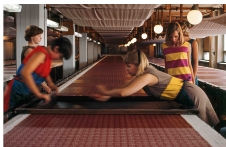
ヘルシンキにあるマリメッコのプリント工場 (1965年) Photo: Tony Vaccaro / Tony Vaccaro Archives * ハンドスクリーンでファブリックをプリントする様子