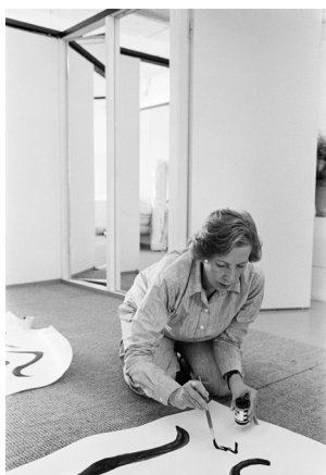
アルミ・ラティア (1912 - 1979)