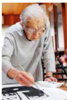
柚木沙弥郎（ゆのき・さみろう）

染色家、1922年東京生まれ。柳宗悦が提唱する「民藝」との出会いを機に、芹沢銈介に弟子入りし染色の道を志す。1955年、銀座のたくみ工芸店にて初個展。以降50年以上にわたり制作を続け、数多くの作品を発表する。フランス国立ギメ東洋美術館、日本民藝館、世田谷美術館をはじめ国内外で展覧会を開催、好評を博す。2024年1月逝去。