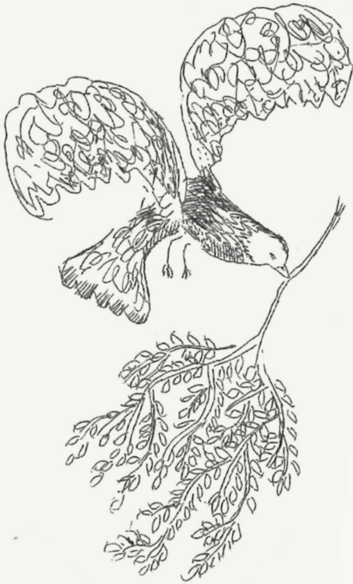
BUILT A NEST ARTWORK BY AKIRA MINAGAWA