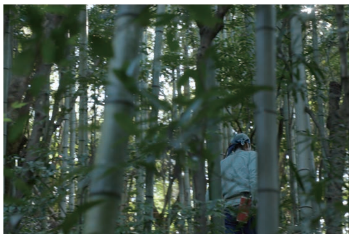
— 『百工のデザイン』展、書籍・映像より