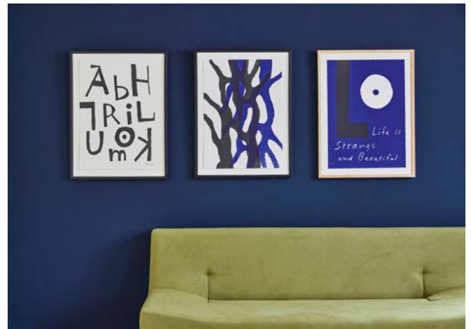
作品「アルファベット」「木洩れ日」 「Life is Strange and Beautiful」