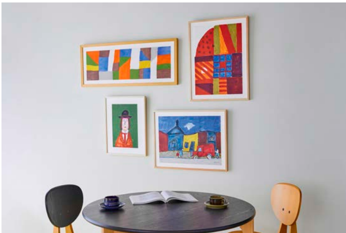
作品（左上から時計回りに）「カタチ」「教会」 「サン・ジェルマン・デ・プレ」「フランスの男」