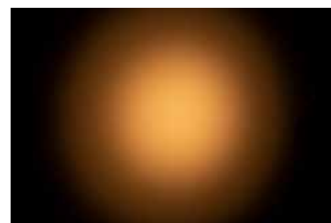
「FINEST NATURAL」 Ra 97 2700K