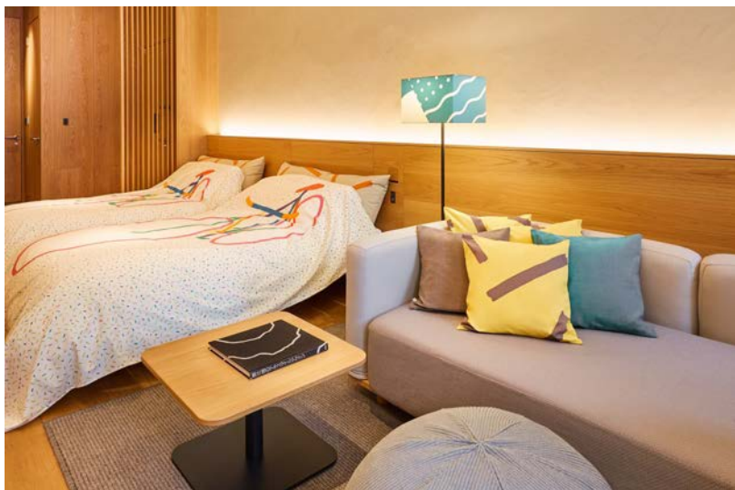
栗辻博氏のテキスタイルが部屋のあちこちに。(MUJI HOTEL GINZA の客室)

1967 年兵庫県生まれ。絵描き。1994 年から 2 年間、世界の旅先で出会った人々のポートレイトを色鉛筆で描き始める。2011 年よりプライベートワークでハンドメイドの恐竜の被り物や立体物を作り始める。著作に「恐竜人間」(パルコ出版)「恐竜がいた」(スイッチ・パブリッシング)など。