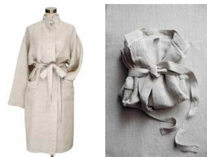
TERVA サウナローブ ¥25,000 カラー：white-linen / black-linen サイズ：S, M 素材：43% tencel・39% washed linen・18% cotton