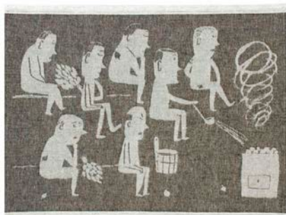
MIESTEN サウナカバー ¥2,600 カラー：white-black サイズ：46x60cm 素材：60% linen・40% cotton

本国のラプアン カンクリが提案するサウナアイテムを、日本でも販売をスタートします。タオル、スリッパ、ヘアターバン、ウォッシュミトン、サウナバッグ、といろいろなアイテムを取り揃えています。ラプアン カンクリのリネンアイテムは速乾性と吸水性に優れているので、日本の気候にも合いますし、お風呂や温泉、スパなどの用途でも活躍します。(価格は全て税抜です)