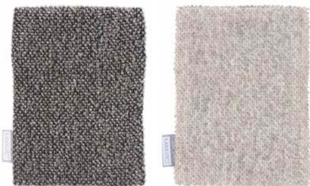
KIVI ソープスクラブミット ¥1,600 カラー / black-line 素材：55% linen・32% cotton・13% tencel カラー / white-linen 素材：70% linen・30% cotton