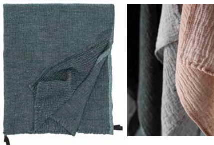
NYTTI タオル ¥2,000～¥11,000 カラー：black-green, black-grey, white-cinnamon, white-grey サイズ：38x38, 65x65, 65x130, 95x180(cm) 素材：33% tencel・45% washed linen・22% cotton