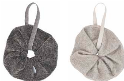
KIVI シャワーパフ ¥2,200 カラー / black-line 素材：55% linen・32% cotton・13% tencel カラー / white-linen 素材：70% linen・30% cotton