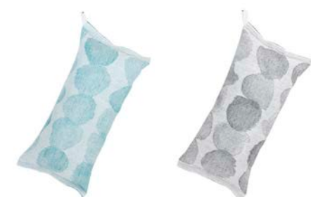
SADE サウナピロー ¥4,400 (写真左) など サイズ：20x46cm 60% linen・40% cotton / 中素材 100% polyester カラー：white-turquoise / white-grey