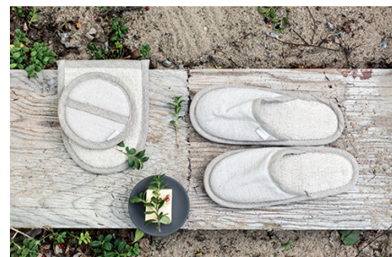
ONNI スリッパ ¥6,000 カラー/サイズ：linen (XS/ S) black-linen (S) ONNI コスメティックスポンジ ¥1,600 カラー：linen / black-linen 素材：70% linen・30% cotton