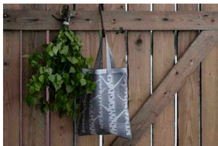
KOIVU バッグ ¥3,000 カラー：white-black サイズ：28x33cm 素材：60% linen・40% cotton