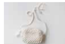
Littu (ショルダーポーチ) 素材：コットン地+リネン カラー：ナチュラル 25,000円