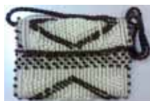
SUNI (ショルダーバッグ/クラッチ) 素材：コットン地+リネン カラー：ナチュラル/ブラウン 33,000円