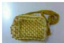
Littu (ショルダーポーチ) 素材：コットン地+コットン カラー：マスタード 25,000円