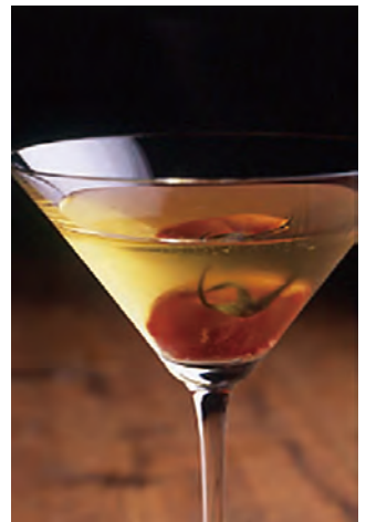
ブルックリンマティーニ ¥1,200