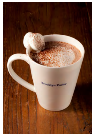
オリジナルブレンドコーヒー ¥550 カフェモカ ¥650 ※写真はカフェモカです。