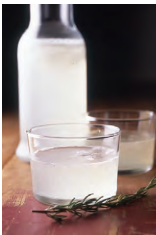
レモネード グラス ¥600 デキャンタ ¥1,300