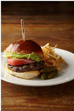
ハンバーガー ¥1,200 トッピング 各¥200