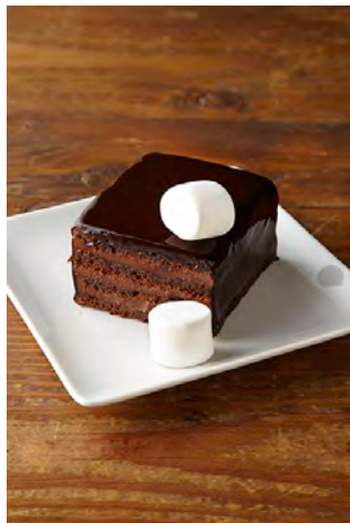
クラシックデビルチョコレートケーキ ¥800 Osaka Special