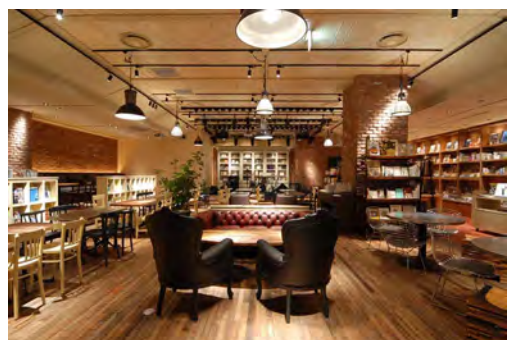
新宿本店/新宿マルイアネックス B1F 2009年9月