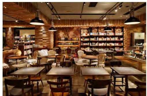
博多店/博多リパレイン 1F 2012年4月