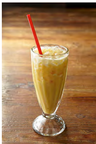
ミックスジュース ¥650 Osaka Special