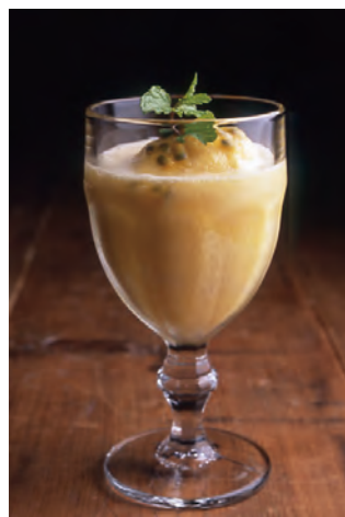
スムージー 5種 各¥750 ※写真はココナッツパイ