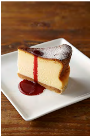
ニューヨークチーズケーキ ¥800 Osaka Special