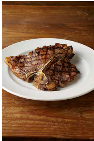
Tポーンステーキ (450g) ¥4,800 Osaka Special