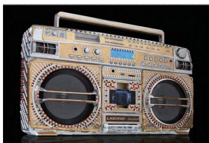
Lasonic x Colette x Hirschell