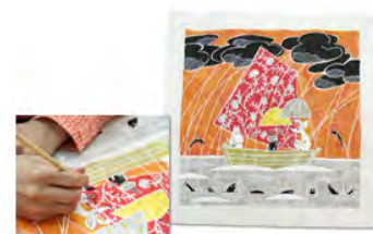
図案が決まったら、大判のラフを作成。絵の具で着色していく。