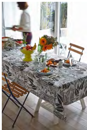
マルチクロス Sサイズ ¥6,000- Lサイズ ¥8,500-