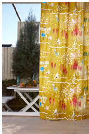
オーダーカーテン