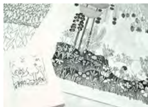
愛用の手帳にイメージをスケッチするところからデザイン開始