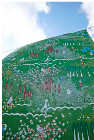
ここにいるよ (グリーン・マスタード)