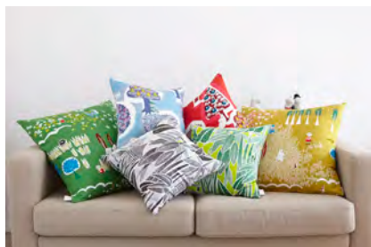
クッションカバー 45 cm角 ¥2,800- 60 cm角 ¥3,800-