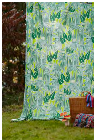
旅の途中 (ブラック・グリーン)