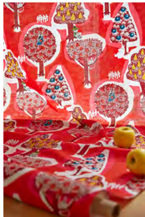
森のいろいろ (レッド・ブルー)