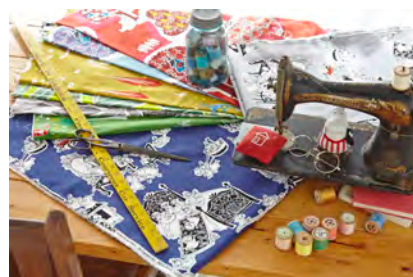
カットクロス 1リピート ¥2,600-