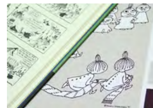
図案に登場するキャラクターは、原作からポーズを抜き出して描かれている