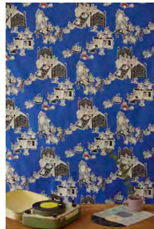
ミイがやって来た! (グレー・ブルー)